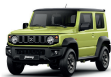
COLORES JIMNY 3 PUERTAS: