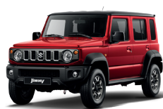
COLORES JIMNY 5 PUERTAS: